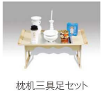
枕机三具足セット