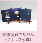
葬儀記録アルバム (スナップ写真)

(その他費用) ●会館施設利用料 ●後飾りスタッフ(移行料) ●設備運営補助費用