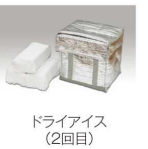
ドライアイス (2回目)