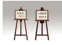
式場看板・案内看板