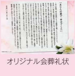
オリジナル会葬礼状