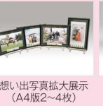
思い出写真拡大展示 (A4版2～4枚)