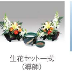
生花セット一式 (導師)