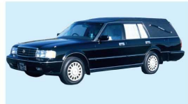
搬送車(病院～会館10km以内)