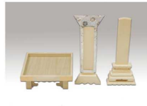
位牌 (白木位牌・野位牌・野膳)