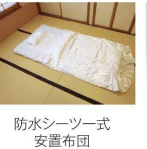
防水シーツ一式 安置布団