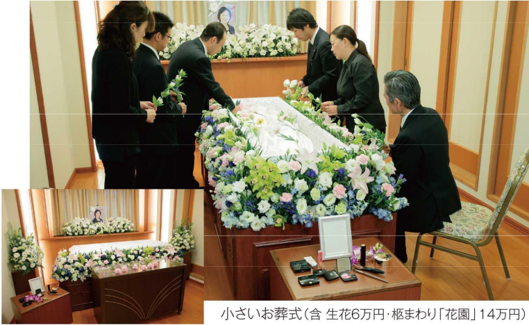
小さいお葬式(含 生花6万円・柩まわり「花園」14万円)