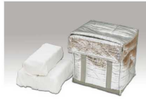
ドライアイス(1回目)